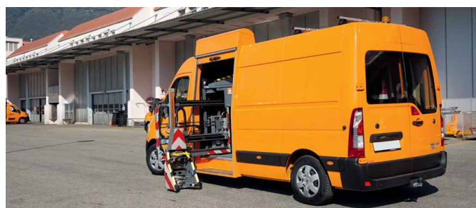
Beweglicher Kopf, ausgestattet mit einem Sensor. Zum präzisen Absetzen und Aufnehmen der Kegel.