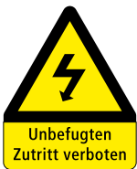
Bildgrösse 350 × 500 senkrecht