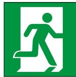
Bildgrösse 1000 × 500 aufgerständert