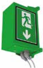
Bildgrösse 350 × 500 senkrecht

Gehäuse aus Edelstahl rostfrei V4A, Pulverbeschichtet nach RAL, Frontscheibe aus ESG Glas oder PMMA, Druckfest bis +/-10 kPa (Version ESG Glas), Dichtheit nach IP65 (überwaschbar), Druckfest, EMV Verträglichkeit, Vibrationstest, Klimatest, Nutzlebensdauer 80'000h