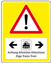
Bildgrösse 350 × 500 senkrecht

Trägermaterial rostfreier Cr-Ni-Mo-Stahl oder Aluminium 2 mm, Siebdruck mit nachleuchtender Farbe, Decklack transparent und chemikalienresistent