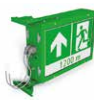
Bildgrösse 700 × 600 Wandmontage