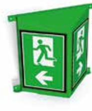
Bildgrösse 350 × 500 senkrecht