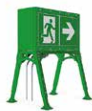
Bildgrösse 1000 × 500 aufgeständert