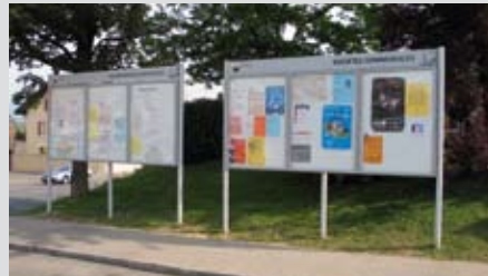
Schaukastensystem in Grand-Saconnex

In den zwei Genfer Gemeinden Grand-Saconnex und Vernier sind Schaukastensysteme als Informationsträger installiert, in welchen die diversen Gemeindeinformationen Platz finden. Die durch die SIGNAL AG eigens produzierten Aufstellvorrichtungen mit den integrierten Vitrinen im Format B4 stellen eine saubere und zugleich ästhetische Lösung dar.