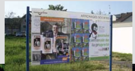
Freie Plakatierung für Vereine

Beide Gemeinden sind mit ihrer Informationsart sehr zufrieden und finden grossen Gefallen an der sauberen Lösung.