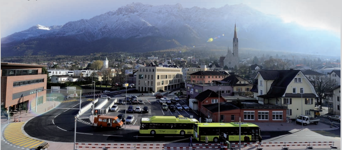
Neue Verkehrsführung in Schaan sorgt für einen flüssigen öffentlichen und Individualverkehr

Das Nadelöhr mitten in Schaan hat einen Namen. Es heisst oder, besser gesagt, es hiess: Lindenplatz. Seit Jahren passierten täglich rund 20 000 Fahrzeuge und 300 Busse diese Kreuzung. In Stosszeiten war selbst die moderne Ampelanlage masslos überlastet. Dies führte dazu, dass die umliegenden Quartiere und Wohnstrassen als Schleichwege genutzt wurden. Auch der öffentliche Verkehr wurde behindert und Verspätungen waren an der Tagesordnung. Mit dem neuen Kreisels hat sich dies nun geändert.