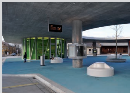
Neuer Bushof mit Tiefgarage

Die SIGNAL AG ist stolz, wenn sie an einem der grössten liechtensteinischen Strassenbauvorhaben teilhaben kann. Auch wenn der Anteil der Strassensignalisation gemessen am Gesamtprojekt klein ist, so ist das Engagement gegenüber dem Kunden genauso intensiv und verbunden mit dem Ziel, zum gewünschten Zeitpunkt die richtige Leistung am richtigen Ort in bester Qualität zu erbringen.