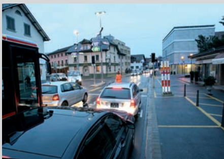
22.11.10: Kurz vor Verkehrsfreigabe

Vier Monate ist der Kreisel nun in Betrieb. Das Echo aus der Bevölkerung ist sowohl von den Automobilisten als auch von den Nutzern des öffentlichen Verkehrs durchwegs positiv.