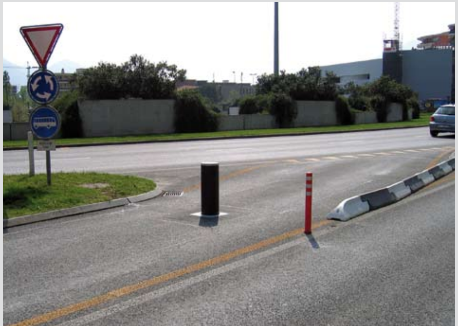
Locarno: Fahrspur mit automatischer Polleranlage für autorisierte Fahrzeuglenker

Areal. An der Steuersäule wurde zusätzlich eine Gegensprechanlage eingebaut, sodass sich beispielsweise Lieferanten anmelden und auf Knopfdruck eingelassen werden können. Eine Videoüberwachung informiert jederzeit über die Geschehnisse bei der Anlage, sodass bei Bedarf sofort gehandelt werden kann.