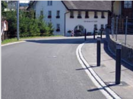
Fussgängerschutz mit Poller und Trottoir

Mit der Sanierung der Dorfstrasse und der Aufwertung des Ortsbildes beschloss die Gemeinde, in demselben Aufwisch auch die Sicherheit für Fussgänger zu verbessern. Seit der Einweihung der neuen Dorfstrasse Anfang Juli 2008 sind die Passanten nun besser geschützt – durch Trottoirs, Mehrzweckstreifen und Poller.