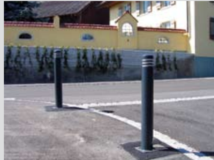
Poller säumen Mehrzweckstreifen

Die Dorfstrasse von Birrhard, die Kantonsstrasse K 400, war in einem baulich schlechten Zustand, weshalb eine Sanierung ins Auge gefasst wurde. Die Strasse war teilweise unübersichtlich und bot Fussgängern nur ungenügenden Schutz. Deshalb war für die Projektbeteiligten von Beginn weg klar, dass auch diese Problematik angegangen werden musste. So lag die Zielsetzung neben der Sanierung der Dorfstrasse in der Verbesserung des Fussgängerschutzes entlang der Strasse und in der Aufwertung des Ortsbildes durch eine bessere Einbettung der Kantonsstrasse K 400 ins Ortsbild.