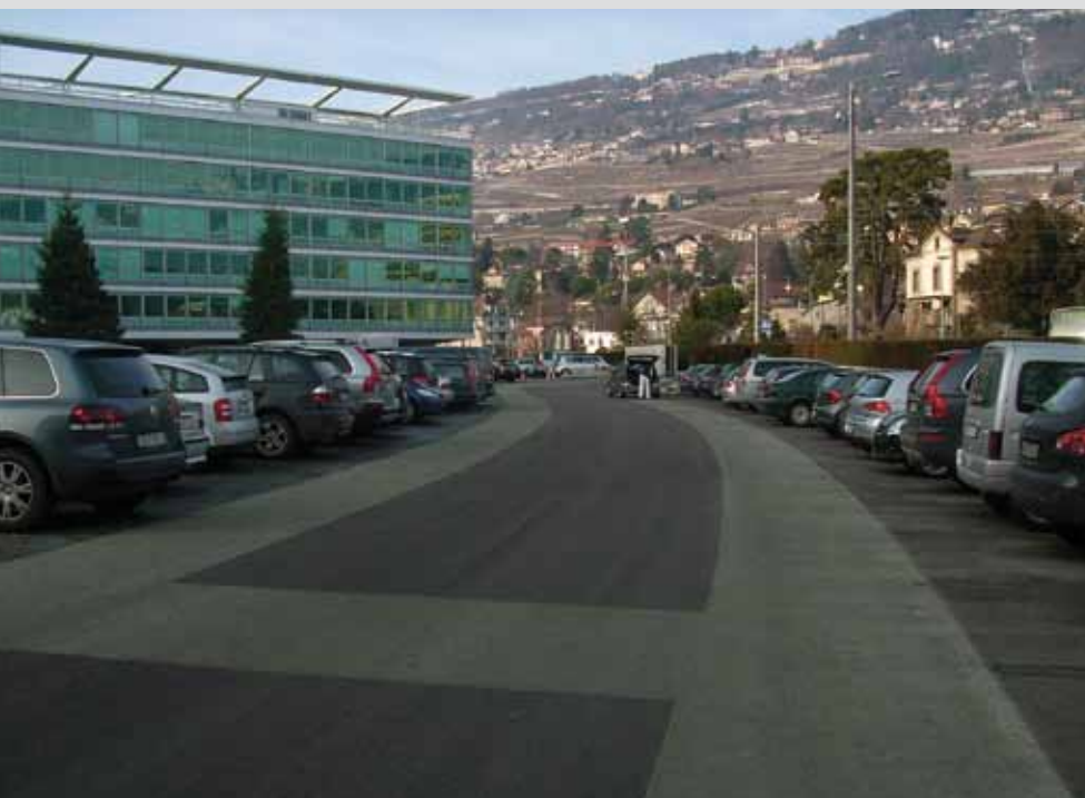
Klare Zonierung der Parkflächen und Verkehrswege mittels Granulatflächen, die sich farblich abheben – Firmenareal Nestlé, Vevey

Granulat eignet sich auf Strassen, Plätzen, Rad- und Fusswegen und ebenso als farbliches Element in Kreiseln und auf Nebenverkehrsflächen.