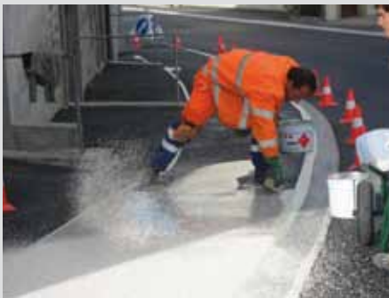
Markierequipe im Einsatz