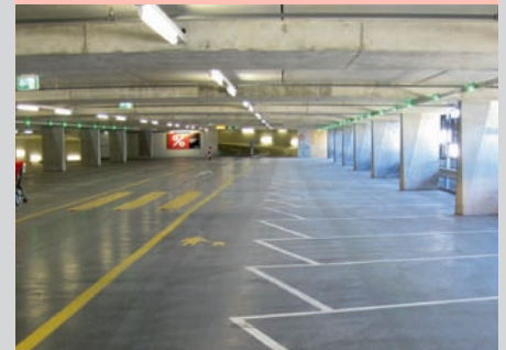
...wurde bereits eröffnet