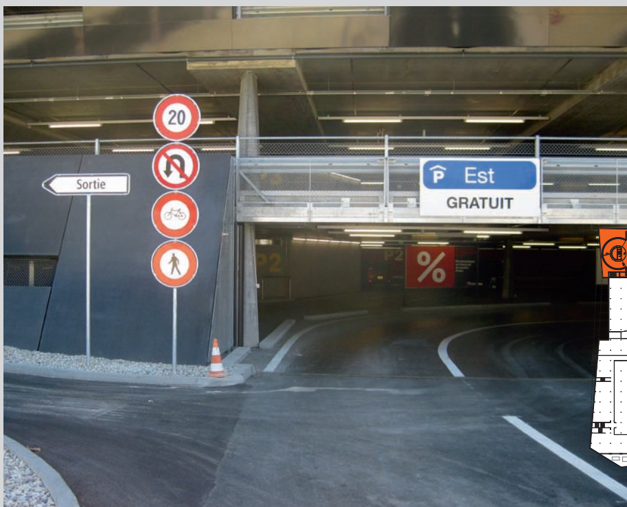
Einfahrt Parkhaus Nouveau Marin-Centre (NMC)