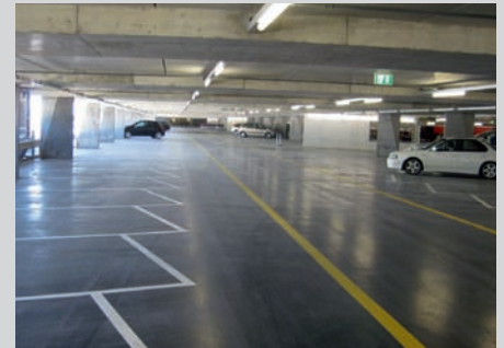
Parkhaus in La Chaux-de-Fonds...

Für die Markierungsequipen der SIGNAL AG gibt es noch einiges zu tun, bis dann alle Parkplätze auf den fünf Stockwerken markiert sind. Insgesamt verfügt das Center über 1300 Parkplätze.