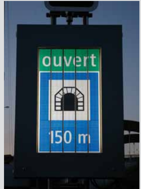
Prismenwender (oben), ausgel. und LED-Signale (unten)