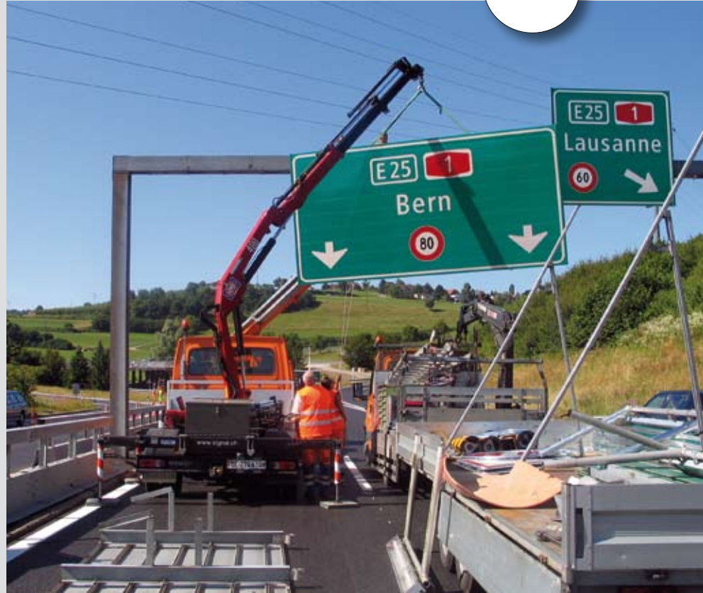
Montage der neuen Grossflächentafel durch die Equipe der SIGNAL AG

Auch die SIGNAL AG leistet ihren Beitrag dazu. So werden am Hauptsitz in Büren a. A. die grossflächigen Autobahnschilder und die Polizeisignale hergestellt, welche erneuert werden. Aber nicht nur die Produktion, auch die Montageequipe der SIGNAL AG ist massgebend am Projekt beteiligt.